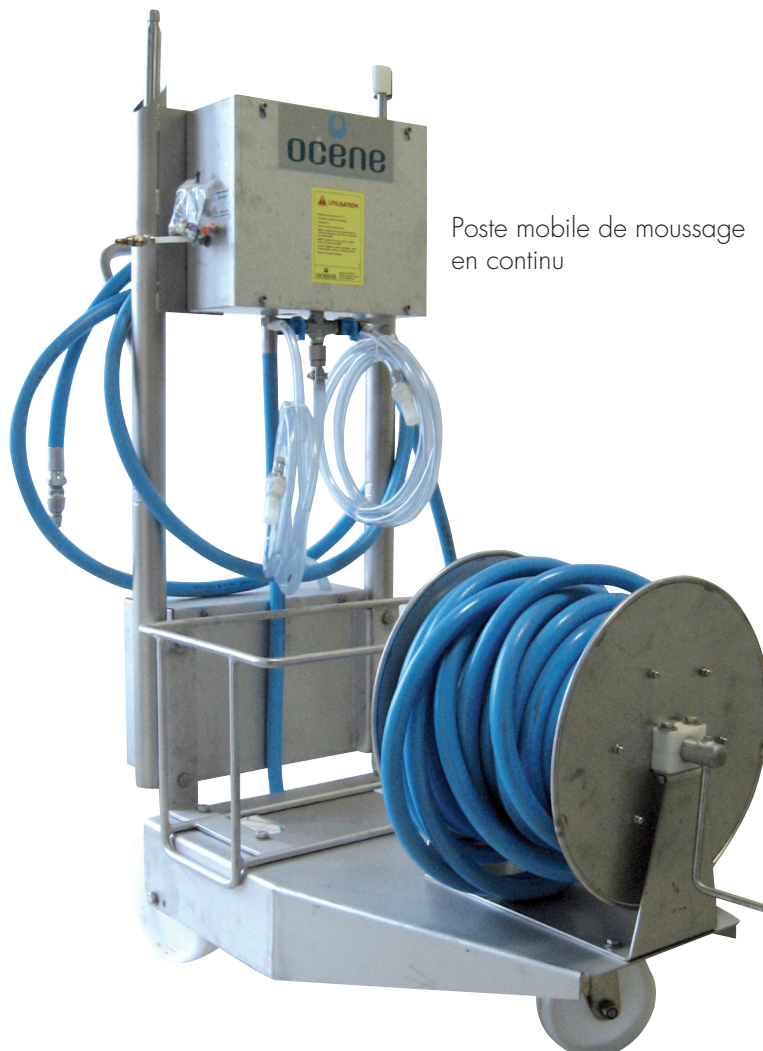
Poste mobile de moussage en continu